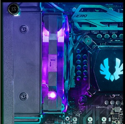
120mm ( radiator )